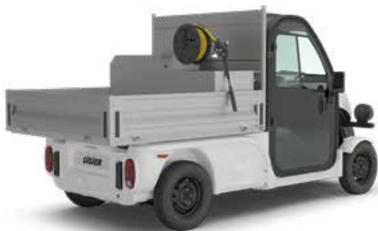
FLAK + HÖGTRYCKSTVÄTT OCH TANK 130 bar - 200 liter tank