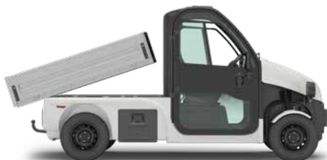
FLAK MED HYDRAULISK TIPPFUNCTION