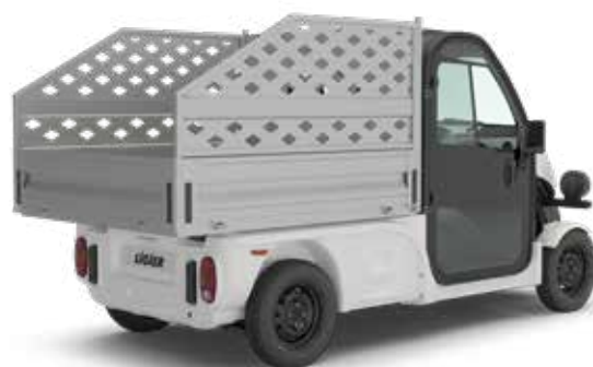
FLAK MED "LÖVGALLER"