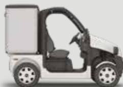
PULSE 4 - L1