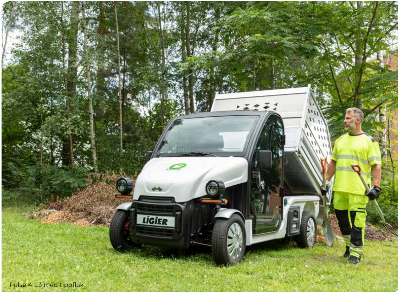
Pulse 4 L3 med tippflak

Finns även i kort version. Välj som lätt lastbil eller mopedbil för förare med AM-körkort från 15 år!