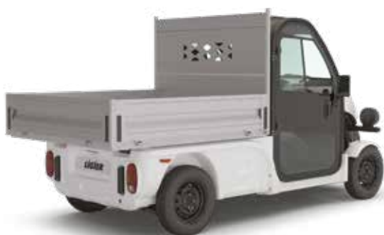
STORT FLAK. 163X146 CM Med nedfällbara sidolämningar