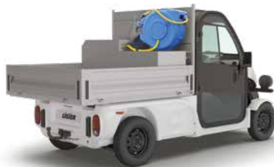
FLAK + BEVATTNINGSAGGREGAT 200 liter tank, 15 m slang