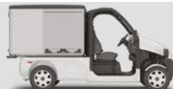
PULSE 4 - L3