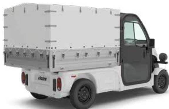
FLAK MED KANVASTOPP