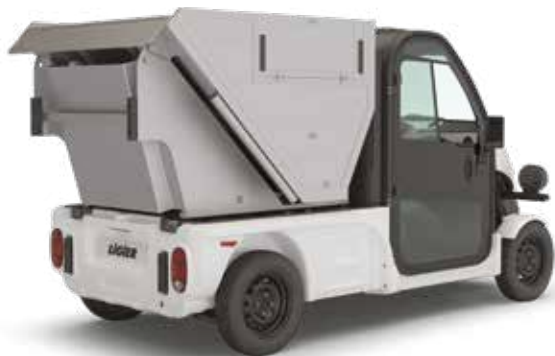
SOPBIL FÖR TRÅNGA GATOR