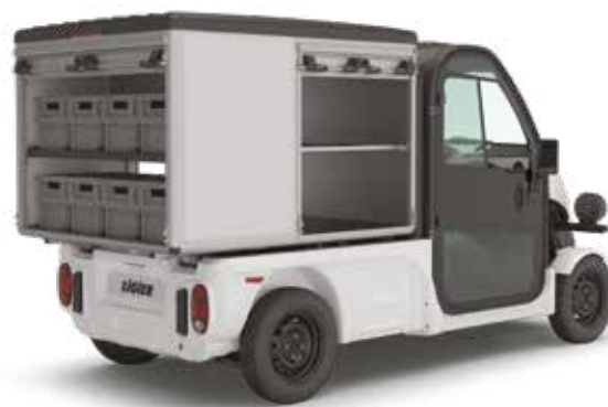
FÖRVARING MED JALUSIDÖRRAR