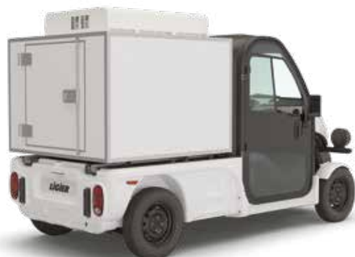
KYLBIL MED EGEN BATTERIBANK